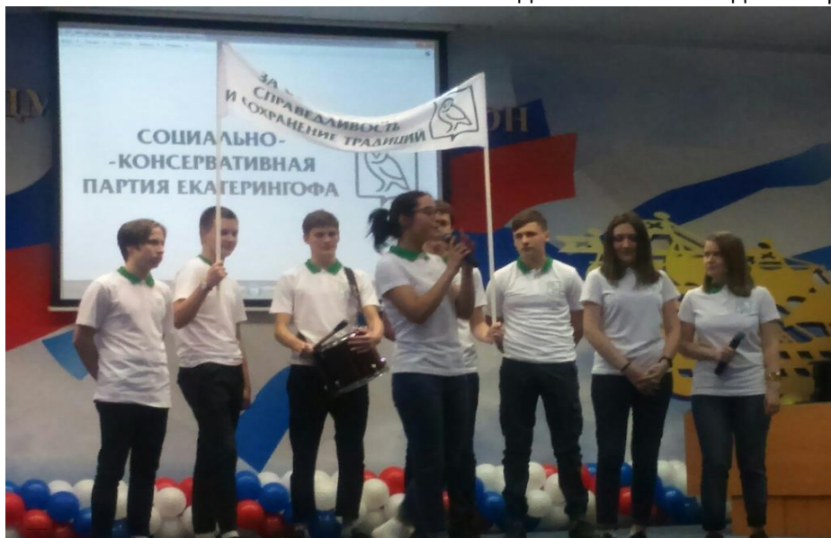
Самообследование за 2019 год ГБОУ средней школы № 287 Адмиралтейского района